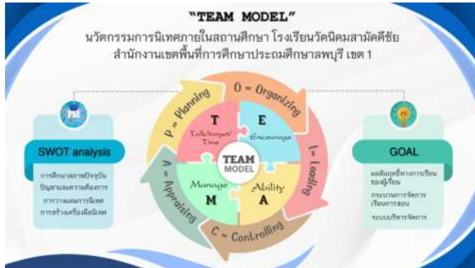
ภาพที่ 1 ผังรูปภาพโมเดล TEAM MODEL

คณะกรรมการการศึกษาขั้นพื้นฐาน (สำนักงานคณะกรรมการการศึกษาขั้นพื้นฐาน, ๒๕๔๙ : ๕๒) กล่าวว่า “การจัดการที่ดีเป็นกุญแจนำไปสู่ความสำเร็จขององค์กร การนิเทศที่ดีนำไปสู่การจัดการที่ดี” ดังนั้นโรงเรียนวัดนิคมสามัคคีชัยจึงได้นำนวัตกรรม “TEAM MODEL” มาประยุกต์ใช้ในการนิเทศภายในด้วย ดังนี้