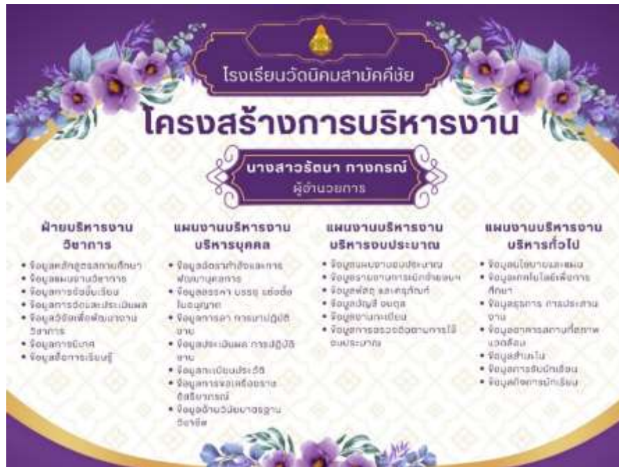
ภาพที่ 2 รูปโครงสร้างการบริหารงาน