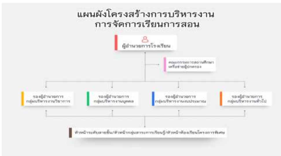
ภาพที่ 3 รูปโครงสร้างการบริหารด้านการจัดการเรียนการสอน